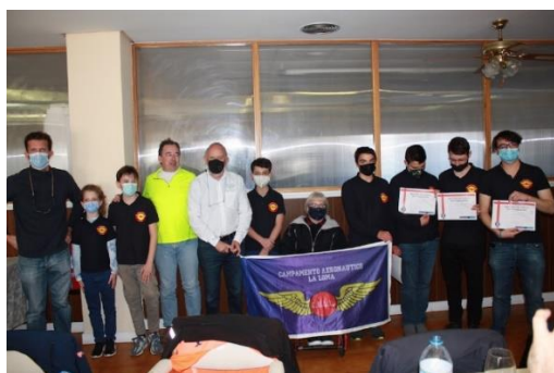
Cadetes del C.A.L.L. con nuestra presidenta