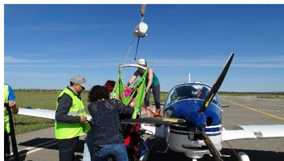
...para ayudar a meter a los "copilotos" en la cabina