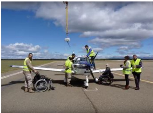
Instalados a bordo