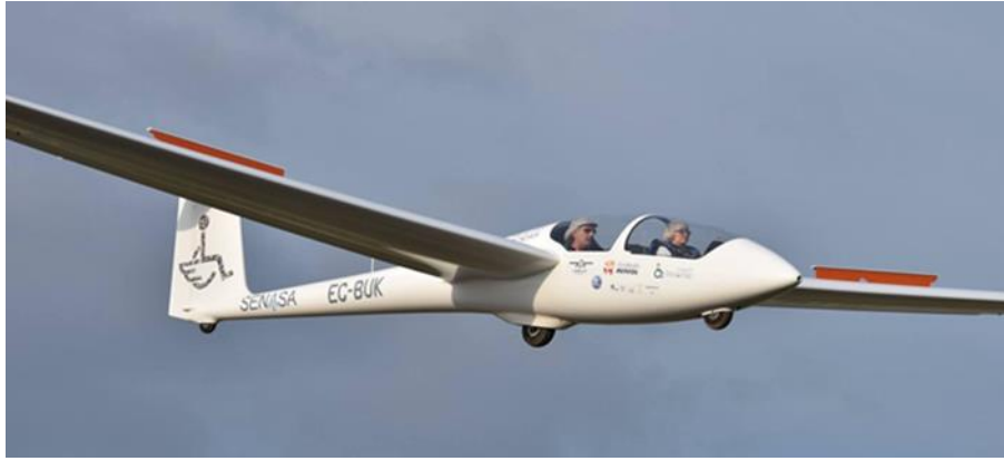
El EC-BUK con el logo de LSV pilotado por una persona con discapacidad

La idea principal era adaptarlo también, en su cabina delantera y trasera, para ser pilotado con las manos. Tardamos unos tres largos años en encontrar financiación para ello. Tuvimos algunas donaciones, en principio, insuficientes, pero la aportación generosa de un particular nos permitió, finalmente, llevarlo a la fábrica de A.Schleicher, muy cerca de la “Wasserkuppe”, la montaña conocida como la “cuna del vuelo sin motor”. Desde 2018 hasta la fecha ha hecho 393 Vuelos.