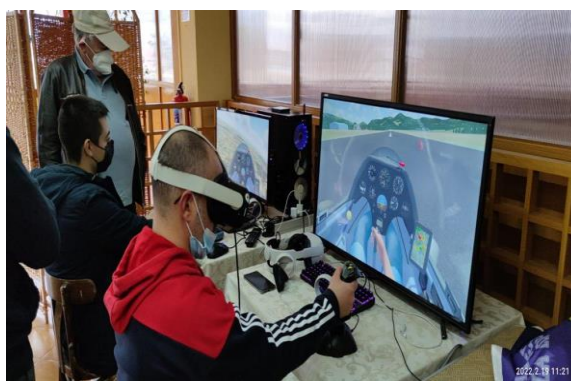
Volando en el simulador