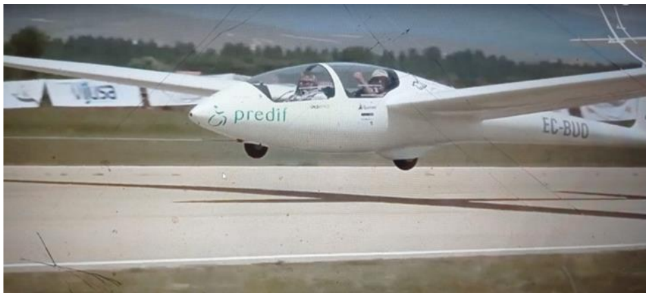
El EC-BUO, primera aeronave adaptada para el vuelo con discapacidad en España

Con fecha 25 de abril de 2000 la Fundación Airtel (actual Fundación Vodafone España), la DGAC, SENASA y PREDIF, suscribieron un Convenio de Colaboración por el que se preveía la adaptación de una aeronave para facilitar el pilotaje de personas con discapacidades motoras y permitirles obtener la licencia de piloto de planeador. Por este mismo convenio, la DGAC cedió a SENASA por 10 años el avión planeador ASK-21 matrícula EC-BUO de su propiedad, que tras la oportuna adaptación costeada por la Fundación Airtel, permitió la utilización del velero para los fines perseguidos en el convenio. El proyecto social del vuelo a vela para personas con discapacidad arrancaba en el año 2000 y con el EC-BUO volábamos en la primera aeronave adaptada al manejo manual en España. El sueño iba tomando forma.