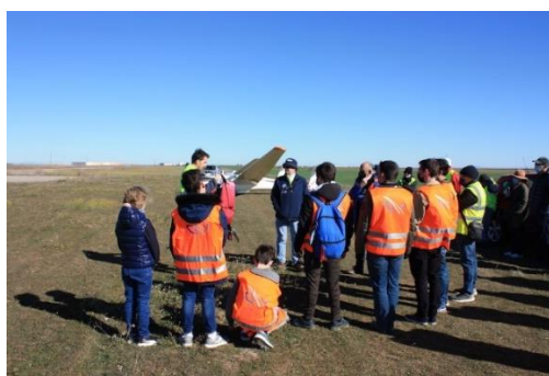
Atentos a las explicaciones