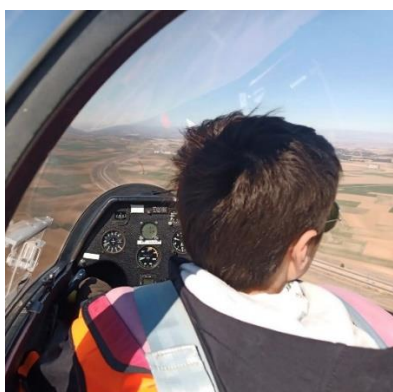
Surcando los cielos manchegos