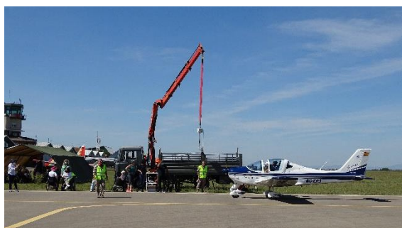
La grúa de la base ya estaba preparada ....