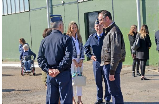
Los organizadores con el coronel de la Base Aérea y nuestra presidenta al fondo