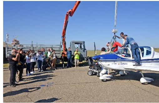
El apoyo con personal y medios del Ejército del Aire fue vital para el éxito de las jornadas