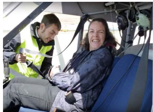
Emocionada en cabina