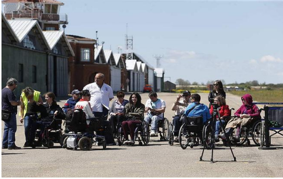
Reunidos frente a los hangares del aeródromo